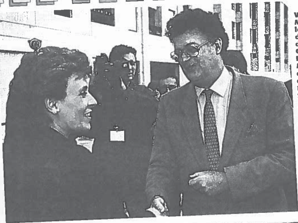
Visite à Montpellier le 12 décembre d'Edith Cresson, Premier Ministre, en compagnie de Jean-Pierre Soisson, Michel Delebarre et Martine Aubry. Résultat : une enveloppe de 140 millions de francs pour les grands projets de Montpellier.