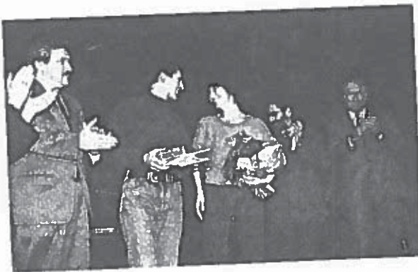
Le millionième spectateur du Zénith fêté par Jane Birkin le 2 décembre.